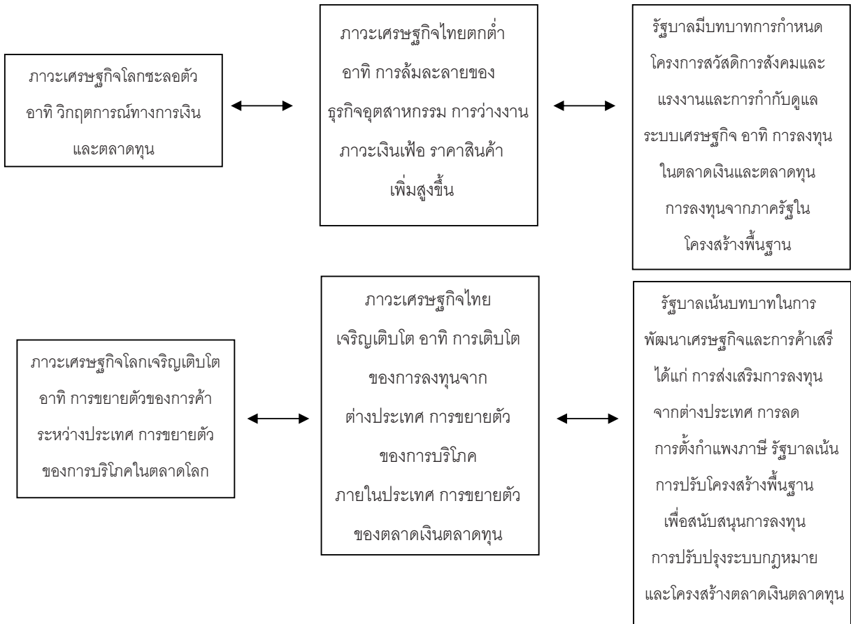
ภาพที่ 2: คาดการณ์บทบาทของรัฐในสภาวะเศรษฐกิจต่างๆ