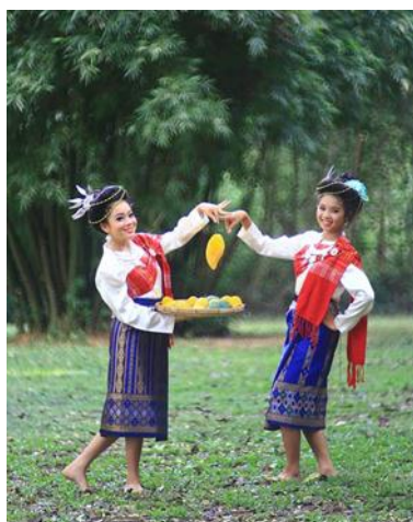
ท่ารำ มะม่วงมะปรางแซบหลาย