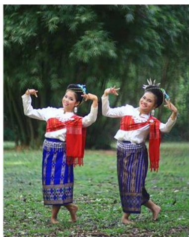
ท่ารำ น้ำตกก็สวยสุดแสน

จากตาราง 1 ผลการประเมินคุณภาพหลักสูตรฝึกอบรมนาฏศิลป์พื้นบ้าน เรื่องเสน่ห์เนินมะปราง สำหรับนักเรียนชุมชนนาฏศิลป์ไทย ระดับมัธยมศึกษาตอนต้นพบว่า คุณภาพของหลักสูตรโดยภาพรวมอยู่ใน ระดับมากที่สุด เมื่อพิจารณาประเด็นย่อยพบว่า มีระดับคุณภาพอยู่ในระดับมากที่สุดทุกรายการ