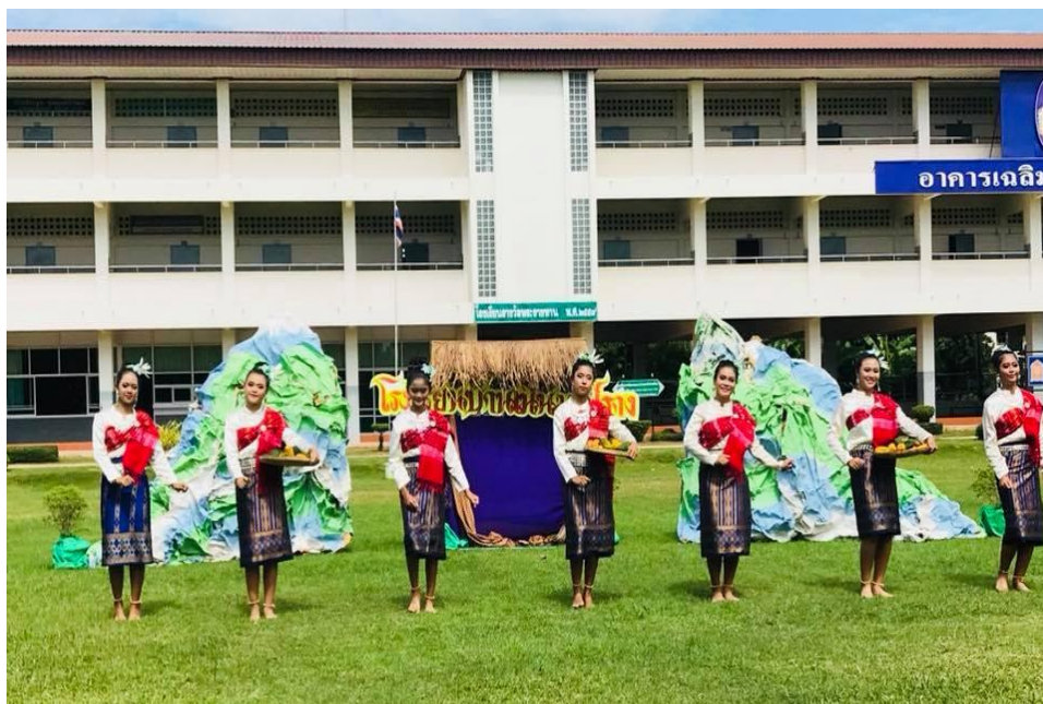
ภาพ 4 การแสดงผลงานเพื่อประเมินทักษะปฏิบัติ