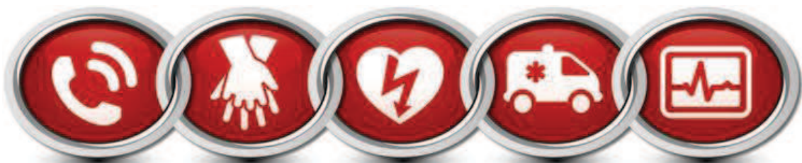
ภาพที่ 1 แสดงห่วงโซ่แห่งการรอดชีวิต (change of survival) (American Heart Association, 2010 : S677)

1.5 บูรณาการการดูแลหลังการช่วยฟื้นคืนชีพสำเร็จ