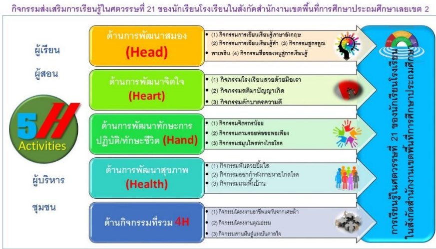
ภาพแสดง รูปแบบกิจกรรมส่งเสริมการเรียนรู้ในศตวรรษที่ 21 ของนักเรียนโรงเรียนในสังกัดสำนักงานเขตพื้นที่การศึกษาประถมศึกษาเลยเขต 2