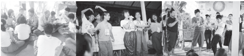
ภาพที่ 11 - 13 กิจกรรมการเรียนรู้ในค่ายเพาะกล้าพันธุ์เก่งเพลงพื้นบ้าน

การเป็นผู้นำในกิจกรรมสันตนาการเพื่ออำนวยความสะดวกและช่วยเหลือในด้านต่าง ๆ แก่ครูเพลงด้วย