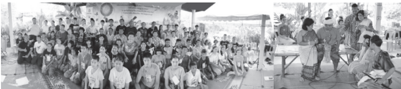
ภาพที่ 7-8 ผู้เข้าอบรมเชิงปฏิบัติการเพลงฉ่อย และเพลงทรงเครื่อง

การสังเกตและการบันทึกความเปลี่ยนแปลงที่ชุมชนเกิดจิตสำนึก นั้น จากการสังเกตกระบวนการถ่ายทอดของครูเพลง และสัมภาษณ์ผู้รับการถ่ายทอด ซึ่งได้แก่ ผู้สืบทอดเพลงในแต่ละคณะ และเยาวชนผู้สนใจ ทั้งที่มีความสามารถในการแสดงเพลงพื้นบ้านและไม่มีทักษะและประสบการณ์การแสดงเลย ผลปรากฏว่ากระบวนการถ่ายทอดเริ่มจากการจัดสภาพแวดล้อมการเรียนรู้ต่าง ๆ อย่างเหมาะสม เกิดจิตสำนึก ร่วมกันในการเรียนรู้ ถ้อยทอด สืบทอด และอนุรักษ์เพลงพื้นบ้าน