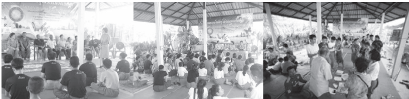
ภาพที่ 2-4 พิธีเปิดโครงการ งานเสวนาวิชาการ และการอบรมเชิงปฏิบัติการเพลงพื้นบ้านภาคกลาง

ขั้นตอนการ คณะผู้วิจัยได้สำรวจและรวบรวมข้อมูลภาคสนามหรือลงพื้นที่จริง จำนวน 29 ครั้ง ระหว่างเดือนมีนาคม-กันยายน 2557 โดยได้รับความร่วมมือจากชุมชนต่าง ๆ อย่างดี และมีการเตรียมจัดทำค่าย “เพาะกล้าพันธุ์เก่งเพลงพื้นบ้าน” ได้แก่ การร่วมเป็นเจ้าของและผู้สนับสนุนทุนดำเนินงาน และการเป็นคณะกรรมการดำเนินโครงการค่ายฯ