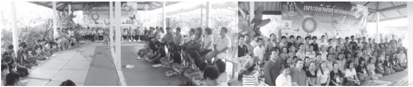
ภาพที่ 5-6 การประชุมเพื่อตรวจสอบ ยืนยันและให้ฉันทามติ