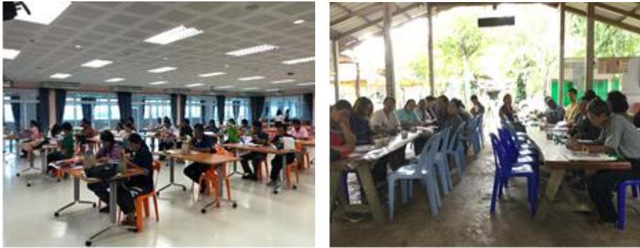
รูปที่ 4 การทดสอบประสิทธิภาพของเอกสารคู่มือการจัดทำบัญชี

ชุมชนการผลิตประมงและเกษตรอินทรีย์ จำนวน 30 คน ณ เครือข่ายวิสาหกิจชุมชนเกษตรอินทรีย์ อำเภอกำแพงแสน จังหวัดจันทบุรี ดังรูปที่ 4