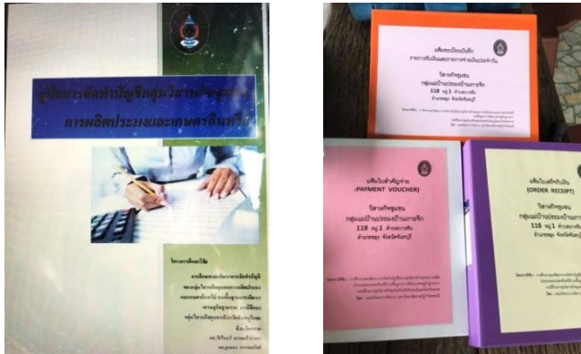
รูปที่ 2 เอกสารคู่มือการจัดทำบัญชี