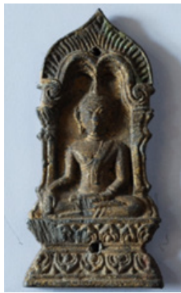
ภาพที่ 16 พระพิมพ์แสดงปางมารวิชัย วัดปงสนุกด้านเหนือ ที่มา : ยุทธภูมิ มั่นตรง

ที่มา : Gordon H. Luce, Old Burma Early Pagan Volume3 (New York : J.J.Augustin Pubuisher,1970),65