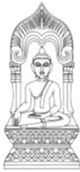
ภาพที่ 8 ภาพลายเส้นพระพิมพ์

แผงที่ 5 พระพิมพ์แผงไม้จากวัดเขาแก้ว อำเภอเถิน จังหวัดลำปาง