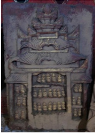
ภาพที่ 13 ภาพพระพิมพ์แฉ่งไม้ วัดบ้านแก้ว ประเทศเมียนมา