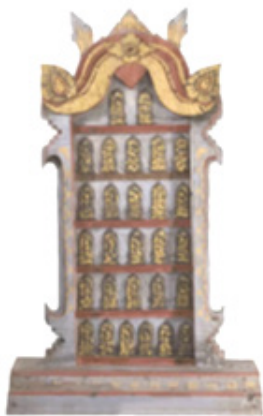
ภาพที่ 1 ภาพพระพิมพ์แม่ไม้

ลักษณะแม่ไม้หลักเป็นรูปกรอบซุ้มหน้านาง ลงรักปิดทอง ฐานสลักรูปลายพันธุ์พฤกษา ขนาดกว้าง 0.47 เซนติเมตร สูง 0.80 เซนติเมตร (ภาพที่ 1) ลักษณะพระพิมพ์แสดงภูมิสถาปัตยกรรม (ปางมารวิชัย) ในซุ้มเรือนแก้ว เป็นรูปพระพุทธเจ้าประทับนั่งขัดสมาธิราบ บนฐานบัวคว่ำบัวหงาย พระหัตถ์ซ้ายวางหงายอยู่ที่พระเพลา พระหัตถ์ขวาวางพาดพระชงฆ์ข้างขวาโดยให้นิ้วพระหัตถ์ชี้ลงเบื้องล่าง พระรัศมีรูปดอกบัวตูม พระวรกายครองจีวรห่มเฉียง องค์พระประทับอยู่ในซุ้มเรือนแก้ว ปลายกรอบซุ้มเป็นรูปหางวัน (ภาพที่ 2) จำนวนพระพิมพ์ 28 องค์ ขนาด พระพิมพ์ กว้าง 4 เซนติเมตร สูง 7 เซนติเมตร วัสดุเนื้อชิน ไม่พบจารึก/อายุสมัย