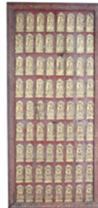
ภาพที่ 7 ภาพพระพิมพ์แผงไม้

ลักษณะแผงไม้ สลักเป็นกรอบสี่เหลี่ยมผืนผ้า ลงชาติประดับลวดลายทอง ขนาดกว้าง 0.62 เซนติเมตร สูง 1.10 เซนติเมตร (ภาพที่ 7) ลักษณะพระพิมพ์แสดงภูมิสปรตมูทรา ในซุ้มเรือนแก้ว เป็นรูปพระพุทธเจ้าประทับนั่งขัดสมาธิราบ บนฐานบัวคว่ำบัวหงาย พระหัตถ์ซ้ายวางหงายอยู่ที่พระเพลา พระหัตถ์ขวาวางพาดพระชงฆ์ข้างขวาโดยให้นิ้วพระหัตถ์ชี้ลงเบื้องล่าง พระรัศมีรูปดอกบัวตูม พระวรกายครองจีวรห่มเฉียง องค์พระประทับอยู่ในซุ้มเรือนแก้ว ปลายกรอบซุ้มเป็นรูปหางวัน (ภาพที่ 8) จำนวนพระพิมพ์ 72 องค์ ขนาดพระพิมพ์ กว้าง 4 เซนติเมตร สูง 7 เซนติเมตร วัสดุเนื้อชิน ไม่พบจารึก/อายุสมัย