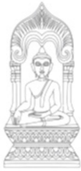
ภาพที่ 12 ภาพลายเส้นพระพิมพ์