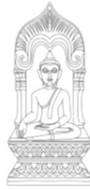
ภาพที่ 10 ภาพลายเส้นพระพิมพ์

แผงที่ 6 พระพิมพ์แผงไม้จากวัดพระธาตูลำปางหลวง อำเภอเกาะคา จังหวัดลำปาง