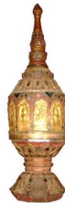
ภาพที่ 11 ภาพพระพิมพ์แผงไม้

ลักษณะแผงไม้ สลักเป็นทรงกลมยอดแหลม ฐานสลักเป็นรูปบัวคว่ำบัวหงาย ประดับพระพิมพ์เรียงแถว 1 แถว ส่วนยอดทำเป็นยอดแหลมลง รักปิดทองประดับกระจกเงิน ความสูงจากฐานถึงยอด 29 เซนติเมตร (ภาพที่ 11) ลักษณะพระพิมพ์แสดงภูมิสถาปัตยกรรมในซุ้มเรือนแก้ว เป็นรูปพระพุทธเจ้าประทับนั่งขัดสมาธิราบ บนฐานบัวคว่ำบัวหงาย พระหัตถ์ซ้ายวางหงายอยู่ที่พระเพลา พระหัตถ์ขวาวางพาดพระขมข้างขวาโดยให้นิ้วพระหัตถ์ชี้ลงเบื้องล่าง พระรัศมีรูปดอกบัวตูม พระวรกายครองจีวรห่มเฉียง องค์พระประทับอยู่ภายในซุ้มเรือนแก้ว จำนวนพระพิมพ์ 12 องค์ ขนาดพระพิมพ์ กว้าง 4 เซนติเมตร สูง 7 เซนติเมตร วัสดุเนื้อไม้ไม่พบจารึก/อายุสมัย