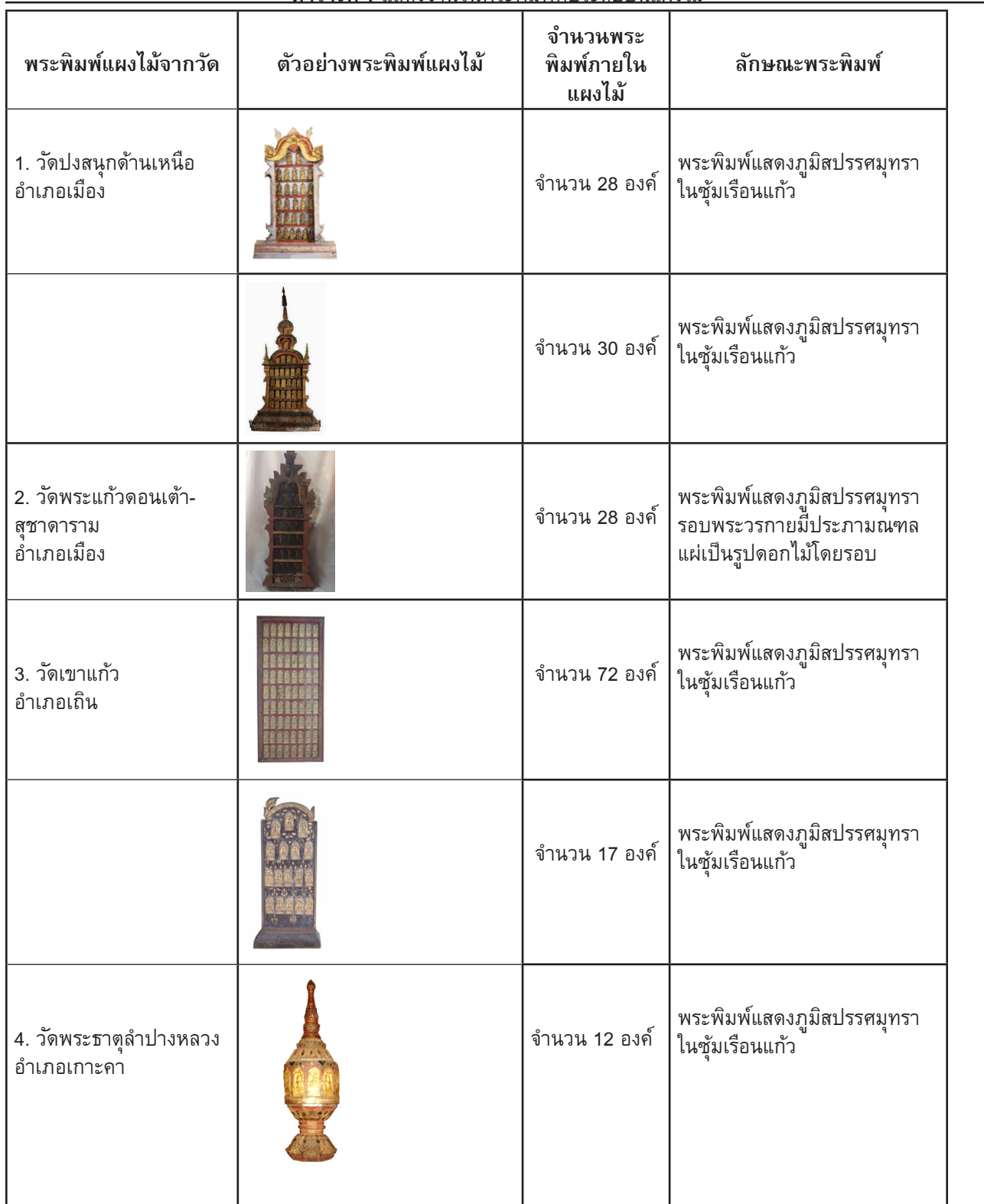
ตารางที่ 1 แสดงจำนวนพระพิมพ์ที่ระดับบนแผงไม้