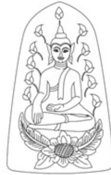
ภาพที่ 6 ภาพลายเส้นพระพิมพ์

แผงที่ 4 พระพิมพ์แผงไม้จากวัดเขาแก้ว อำเภอเถิน จังหวัดลำปาง