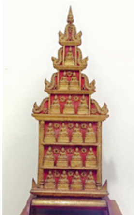
ภาพที่ 14 พระพิมพ์แฉ่งไม้วัดพระธาตุหริภุญไชย