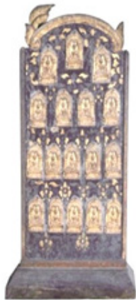
ภาพที่ 9 ภาพพระพิมพ์แผงไม้

ลักษณะแผงไม้ สลักเป็นกรอบวงโค้ง ลงรักประดับลวดลายทอง ขนาดกว้าง 0.82 เซนติเมตร สูง 1.50 เซนติเมตร (ภาพที่ 9) ลักษณะพระพิมพ์แสดงภูมิสถาปัตยกรรมในซุ้มเรือนแก้ว เป็นรูปพระพุทธเจ้าประทับนั่งขัดสมาธิราบ บนฐานบัวคว่ำบัวหงาย พระหัตถ์ซ้ายวางหงายอยู่ที่พระเพลา พระหัตถ์ขวาวางพาดพระขมข้างขวาโดยให้นิ้วพระหัตถ์ชี้ลงเบื้องล่าง พระรัศมีรูปดอกบัวตูม พระวรกายครองจีวรห่มเฉียง องค์พระประทับอยู่ภายในซุ้มเรือนแก้ว (ภาพที่ 10) จำนวนพระพิมพ์ 17 องค์ ขนาดพระพิมพ์ กว้าง 4 เซนติเมตร สูง 7 เซนติเมตร วัสดุเนื้อไม้ไม่พบจารึก/อายุสมัย