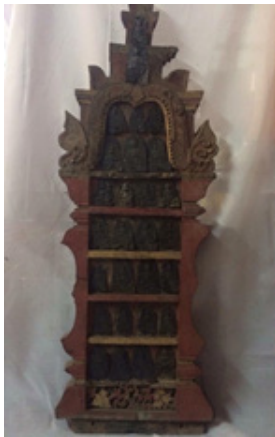
ภาพที่ 5 ภาพพระพิมพ์แผงไม้

ลักษณะแผงไม้ สลักเป็นรูปกรอบซุ้มหน้านาง ด้านบนเป็นรูปปราสาทซ้อนชั้น ลงชาติปิดทอง ขนาดกว้าง 0.50 เซนติเมตร สูง 0.82 เซนติเมตร (ภาพที่ 5) ลักษณะพระพิมพ์ แสดงภูมิสปรตมูทรา เป็นรูปพระพุทธเจ้าประทับนั่งขัดสมาธิราบ บนฐานรูปดอกไม้ขนาดใหญ่ พระหัตถ์ซ้ายวางหงายอยู่ที่พระเพลา พระหัตถ์ขวาวางพาดพระชงฆ์ข้างขวาโดยให้นิ้วพระหัตถ์ชี้ลงเบื้องล่าง พระรัศมีรูปดอกบัวตูม พระกรรณคล้ายกลีบดอก พระวรกายครองจีวรห่มเฉียง มีชายผ้าคล้ายจีบ และด้านหน้าพระเพลา มีริ้วซ้อนกันคล้ายจีบด้านหน้าของผ้านุ่ง รอบพระวรกายมีประภามณฑล แผ่เป็นรูปดอกไม้โดยรอบ (ภาพที่ 6) จำนวนพระพิมพ์ 28 องค์ ขนาดพระพิมพ์ กว้าง 5 เซนติเมตร สูง 6 เซนติเมตร วัสดุแผ่นเงิน (ดุนลาย) ไม่พบจารึก/อายุสมัย