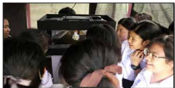
ผู้ชมผลงาน