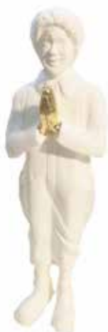
ภาพที่ 4 ผลงานสร้างสรรค์ การไหว้เชิงพาณิชย์