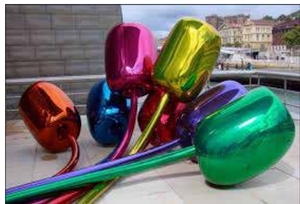
ภาพที่ 6 Tulips by Jeff Koons