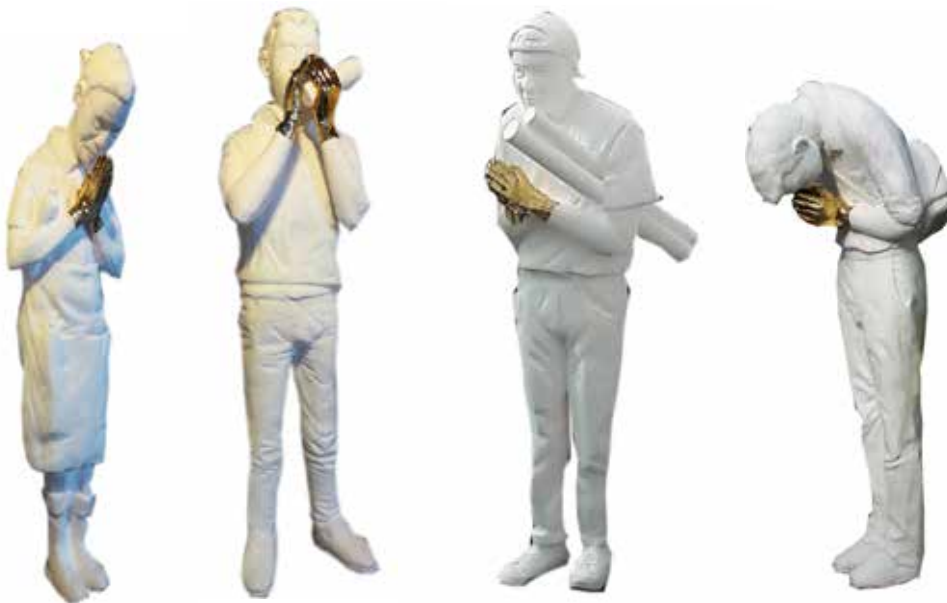
ภาพที่ 3 ผลงานสร้างสรรค์ การไหว้ที่มีมือถือของ