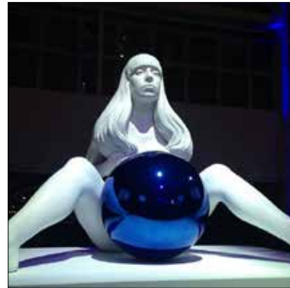
ภาพที่ 5 Lady Gaga by Jeff Koons

ผลงานศิลปะที่ผู้วิจัยนำมากล่าวถึงนี้ ประกอบด้วย ผลงานของ เจฟฟ์ คูนส์ (Jeff Koons), สจู้ คุณาวิชยานนท์, แคลส์ โอลเดนเบิร์ก (Claes Oldenbreg) โดยทั้ง 3 คนนี้มีส่วนเกี่ยวข้องและมีอิทธิพลในการสร้างสรรค์ผลงานศิลปะของผู้วิจัยในด้านเทคนิค แนวความคิด และรูปแบบ