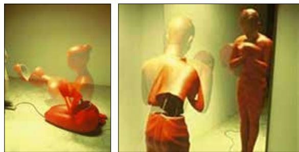
ภาพที่ 7 ชุดภาพความซ้ำซากอันเป็นนิรันดร์ และ วันวานอันแสนหวาน The Eternal Banality

ผู้วิจัได้เห็นว่าผลงานของสุธี คุณาวิชยานนท์ มีรูปแบบของวัฒนธรรมที่ถูกนำไปใช้ในการถ่ายทอดอากัปกิริยาของการไหว้ ซึ่งมีอิทธิพลต่อผู้วิจัส่งผลให้เกิดความสนใจในด้านเรื่องราวของไหว้ในวันวัฒนธรรมไทยและอากัปกิริยาท่าทางจากผลงานของสุธี