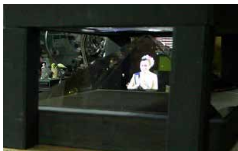
ผลงานฮอโลแกรม (Hologram)