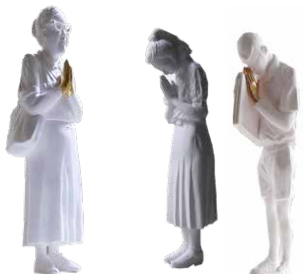
ภาพที่ 2 ภาพผลงานสร้างสรรค์ การไหว้ครู นักเรียน

ผลงานสร้างสรรค์ชุดนี้ เป็นอากัปกริยาของครูและนักเรียนที่แสดงท่าทางการทักทายกับครูผู้รับไหว้ และนักเรียนผู้ไหว้ ผลงานทักทาย สวัสดิ์ผู้ใหญ่ แสดงถึงท่าที่อ่อนน้อมถ่อมตนเมื่อเจอผู้ที่อาวุโสกว่า หรือมีอายุที่มากกว่า ตามหลักมารยาทของวัฒนธรรมไทยนั้นผู้มีอายุน้อยจะต้องเป็นผู้ไหว้ ซึ่งเป็นการบันทึกเรื่องราวระหว่างครู (ตัวผู้วิจัย) กับนักเรียนที่มีปฏิสัมพันธ์ในการไหว้ทักทายแบบวัฒนธรรมไทย โดยลักษณะการไหว้ของนักเรียนบางคน