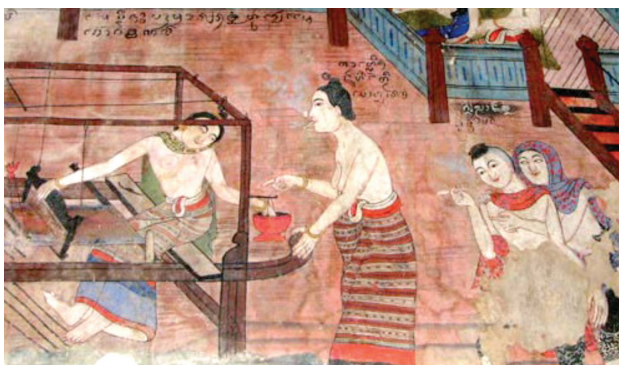
ภาพที่ 1 จิตรกรรมฝาผนังวัดภูมินทร์ แสดงวิถีชีวิตและภูมิปัญญาในการทอผ้า

ภูมิปัญญา (wisdom) คือ ความรู้หรือประสบการณ์ของคนที่ได้รับการถ่ายทอดสืบต่อกันมาจากรุ่นสู่รุ่นหรือถ่ายทอดต่อกันจากชุมชน จากสถาบันครอบครัว ความเชื่อ และศาสนาที่เชื่อมโยงความรู้จากประสบการณ์ที่ได้จากการสะสม จากการประกอบอาชีพ การเรียนรู้จากธรรมชาติแวดล้อมต่าง ๆ ภูมิปัญญาจึงเป็นการพัฒนาความรู้ ความฉลาด ของคนในสังคม สังคมพัฒนาเกิดเป็นทักษะในการปฏิบัติงานในการดำเนินชีวิต ดังนั้นหากกล่าวถึงภูมิปัญญาพื้นบ้าน กล่าวได้ว่า เป็นองค์ความรู้ความสามารถและประสบการณ์ที่สั่งสมและสืบทอดกันมาอันเป็นความสามารถและศักยภาพในเชิงแก้ปัญหา การปรับตัวเรียนรู้และสืบทอดไปสู่คนรุ่นหลังเพื่อการดำรงอยู่ของมรดกทางศิลปวัฒนธรรมของชาติพันธุ์ ซึ่งหากกล่าวถึงแนวคิดในการดำรงอยู่ภายใต้ภูมิปัญญาพื้นบ้านแล้วคงหลีกเลี่ยงไม่ได้ที่จะพูดถึงแนวคิดแห่งการพึ่งพาธรรมชาติมาใช้เป็นหัวใจของเครื่องใช้ที่เป็นการดำรงชีวิตตามปัจจัยพื้นฐาน