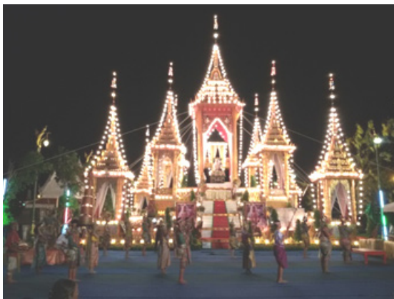
ภาพที่ 3 ภาพการแสดงโขนในงานพระราชทานเพลิงศพข้าราชการชั้นผู้ใหญ่ในจังหวัดสมุทรปราการ ณ วัดบางหัวเสือ จังหวัดสมุทรปราการ ที่มา : ภาพถ่ายโดยผู้วิจัย เมื่อวันที่ 5 เมษายน 2558