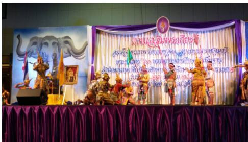
ภาพที่ 2 ภาพการแสดงโขนเปิดงานนิทรรศการเฉลิมพระเกียรติ สมเด็จพระเทพรัตนราชสุดาฯ ณ ศูนย์การค้าอิมพีเรียลเวิลด์ สำโรง ถนนสุขุมวิท จังหวัดสมุทรปราการ

กล่าวคือ นักเรียนโขนได้นำองค์ความรู้โดย การซึมซับจากนิสัยของตัวละครที่มีชีวิต ผลของการกระทำมุ่งเน้นในเรื่องทำดีได้ดีทำชั่วได้ชั่ว พัฒนาคุณลักษณะอันพึงประสงค์ของแต่ละบุคคลให้ดีขึ้น และทักษะในด้านต่าง ๆ ทางนาฏศิลป์ไทยไปแสดงเผยแพร่ในสถานที่สำคัญ ต่าง ๆ ของจังหวัดสมุทรปราการเพื่อให้เกิดความรู้ ความเข้าใจ ความจริงใจ และเกิดความรู้สึกที่มีการได้รับรู้ รับชมเรื่องราว การแสดงนาฏศิลป์ไทย