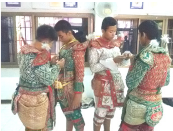
ภาพที่ 6 ภาพนักเรียนโชนโดยพี่ประสบการณ์ช่วยแต่งชุดโชนให้กับน้องประสบการณ์ โรงเรียนมหาภาพระจาดทองอุปถัมภ์ จังหวัดสมุทรปราการ เมื่อวันที่ 28 กุมภาพันธ์ 2558

3.2 การพัฒนาบุคลากรผู้รับผิดชอบกิจกรรม กล่าวคือ เมื่อครูผู้สอนได้ทำการย้ายกลับภูมิลำเนาเดิม (บ้านเกิด) ผู้บริหารหรือผู้ที่มีส่วนเกี่ยวข้องควรบรรจุครูที่มีความสามารถเฉพาะทางหรือเทียบเคียงกับครูผู้สอนเดิม ควรมีการพัฒนาบุคลากรครูผู้สอนโชน หรือครูผู้รับผิดชอบกิจกรรมโชนของโรงเรียนเพื่อให้เกิดความต่อเนื่องเพื่อบริหารความเสี่ยงในการขาดครูผู้รับผิดชอบกิจกรรมโชน และเพื่อการสอนโชนอย่างมีประสิทธิภาพ