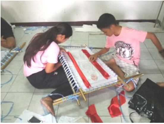
ภาพที่ 5 ภาพนักเรียนโชนกำลังช่วยกันปักชุดโชน โรงเรียนมหาภาพระจาดทองอุปถัมภ์ จังหวัดสมุทรปราการ ที่มา : ภาพถ่ายโดยผู้วิจัย เมื่อวันที่ 11 มีนาคม 2558

3.2 การพัฒนาบุคลากรผู้รับผิดชอบกิจกรรม กล่าวคือ เมื่อครูผู้สอนได้ทำการย้ายกลับภูมิลำเนาเดิม (บ้านเกิด) ผู้บริหารหรือผู้ที่มีส่วนเกี่ยวข้องควรบรรจุครูที่มีความสามารถเฉพาะทางหรือเทียบเคียงกับครูผู้สอนเดิม ควรมีการพัฒนาบุคลากรครูผู้สอนโชน หรือครูผู้รับผิดชอบกิจกรรมโชนของโรงเรียนเพื่อให้เกิดความต่อเนื่องเพื่อบริหารความเสี่ยงในการขาดครูผู้รับผิดชอบกิจกรรมโชน และเพื่อการสอนโชนอย่างมีประสิทธิภาพ