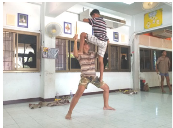
ภาพที่ 4 ภาพการฝึกซ้อมการแสดงโขนของนักเรียนโขนโรงเรียนมหาภาพระจาดทองอุปถัมภ์ จังหวัดสมุทรปราการ ที่มา : ภาพถ่ายโดยผู้วิจัย เมื่อวันที่ 23 กุมภาพันธ์ 2558

ที่มา : แผนภูมิจัดทำโดย ธนินทร์รัฐ กฤษณ์ฉันทัทย์ ศิริวิศาล สุวรรณ และวรรณวีร์ บุญคุ้ม