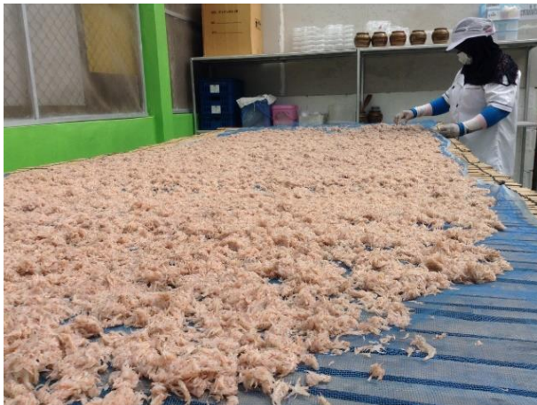
ภาพที่ 2 แสดงการตากตัวเคยของกลุ่มอาชีพทำกะปิ ชุมชนแหลมสัก กระบี่

“...แรกก่อน 4 เราก็อยู่กัน ช่วยกัน หวางนี้ 5 รุ่นใหม่ช่วยกันน้อย แต่ก็มิให้เห็นอยู่มั้ง เหมือนกลุ่มของบ่าว 6 หมด เค้าก็ชวนคนแฉวนี้ ทำเคย 7 ขายกันเอง อด.ไม่ได้เข้ามา มั่ว 8 แต่แรก 9 ฟังมาตอนหลัง เค้าลงหุ้น แบ่งปันผล กำไร ช่วยเหลือเด็กค่านั่งสือบ้าง ตามที่มี สิ่งที่ยอยากให้พัฒนาบ้านเราก้ทำให้เป็นแหล่งท่องเที่ยว เพราะพอนักท่องเที่ยว เข้ามา ทาง 10 ก้จะสบาย น้ำไฟ ก้ดีขึ้น...”