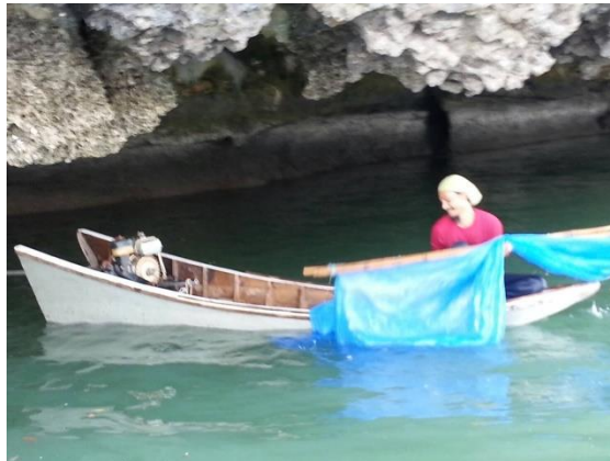
ภาพที่ 1 แสดง การตักตัวเคย เพื่อนำมาทำกะปิของกลุ่มอาชีพทำกะปิ ชุมชนแหลมสัก กระบี่

สำหรับการสนับสนุนของภาครัฐ และการมีส่วนร่วมในสวัสดิการชุมชนของชาวประมงในชุมชนพบว่า เน้นการสร้างความร่วมมือในภาคประชาชน และใช้กฎระเบียบ และการดำเนินงานในชุมชนตามหลักศาสนาอิสลาม มีการพึ่งพาจากรัฐน้อย ยกเว้นระบบโรงเรียนที่ ทางพัฒนาชุมชนเป็นผู้จัดสร้างให้ และระบบสาธารณสุขที่เป็นสวัสดิการสังคมที่ทุกคนควรจะได้อยู่แล้ว ซึ่งผู้วิจัยได้สัมภาษณ์ชาวประมง และ กรรมการหมู่บ้าน เกี่ยวกับประเด็นดังกล่าว รวมถึงสิ่งที่อยากให้พัฒนาความช่วยเหลือ