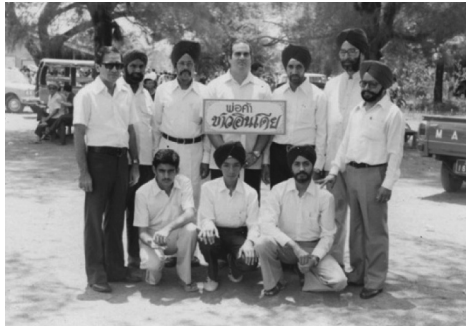
ภาพที่ 2 คณะพ่อค้าชาวอินเดียในอีสาน ส่วนใหญ่เป็นชาวซิกข์ เข้าร่วมงานกิจกรรมที่ จ.อุดรธานี (ไม่ทราบปีของภาพ)

เมื่อสงครามเวียดนามยุติลงและกองทัพสหรัฐอเมริกาถอนทัพออกจากไทยไปแล้ว ลูกค้าหลักที่เป็นทหารใจเื้อของพ่อค้าชาวซิกข์ก็ออกจากอีสาน จนกลายเป็นปัจจัยหลักที่ทำให้พ่อค้าชาวซิกข์ส่วนใหญ่ย้ายกลับกรุงเทพฯ หรือไปพื้นที่อื่นแทน ดังนั้น จึงกล่าวได้ว่า พ่อค้าชาวซิกข์ย้ายเข้าออกอีสานตามทหารใจเื้อในสงครามเวียดนาม