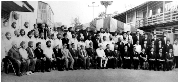
ภาพที่ 3 ภาพหมู่ในพิธีสถาปนาคุรุวารารถาวร จ.ขอนแก่น พ.ศ. 2515/ค.ศ. 1972 (มีการถ่ายภาพ 2 ครั้ง แยกบุรุษกับสตรี)

พื้นที่สุดท้าย คือ นครราชสีมา แม้ว่าจะเป็นพื้นที่ที่เก่าแก่ที่สุดสำหรับพ่อค้า ชาวซิกข์ในอีสาน แต่การสร้างคุรุวารารถาวรเกิดขึ้นเป็นลำดับสุดท้าย พ.ศ. 2527/ ค.ศ. 1984 บนถนนจอมพล หลังจากเข้ามาค้าขายและเช่าสถานที่กลางเป็น คุรุวาราชั่วคราวครั้งแรกในอีสาน ประมาณ พ.ศ. 2463/ค.ศ. 1920 อาศัยพัฒนาการ กว่า 6 ทศวรรษ รวมระยะเวลาค้าขายนาน 9 ทศวรรษเศษ