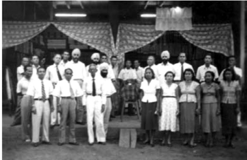
ภาพที่ 1 งานเปิดร้านกุหลาบสโตร์ของพ่อค้าชาวซิกข์ใน อ.บ้านไผ่ จ.ขอนแก่น ที่มา : Kuar (2012)

มาเปิดร้านช่วงที่รถไฟถึงอุบลราชธานี พ.ศ. 2473/ค.ศ. 1930 ขณะนั้นมี 16 ครอบครัว เช่น ห้างร้านยิตสโตร์ ซึ่งย้ายมาจากบ้านบ้านไผ่สโตร์ ขอนแก่น