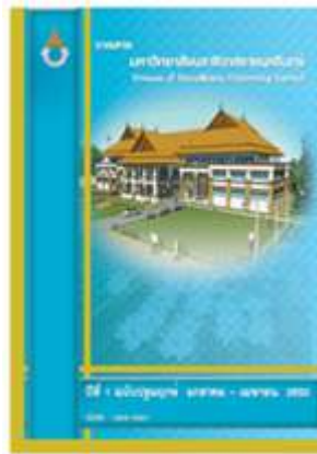
ภาพที่ 1 วารสารมหาวิทยาลัยนราธิวาสราชชนนครินทร์ ปีที่ 1 ฉบับที่ 1(มกราคม - เมษายน 2552)

วารสารมหาวิทยาลัยนราธิวาสราชชนนครินทร์ได้มีการจัดทำเพื่อเผยแพร่ในรูปแบบวารสาร เริ่มผลิตและเผยแพร่ ปีที่ 1 ฉบับที่ 1 (มกราคม - เมษายน 2552) ดังภาพที่ 1 กำหนดเผยแพร่ปีละ 3 ฉบับ ได้แก่ ฉบับที่ 1 ประจำเดือนมกราคม - เมษายน ฉบับที่ 2 ประจำเดือนพฤษภาคม - สิงหาคม และฉบับที่ 3 ประจำเดือนกันยายน - ธันวาคม โดยมีวัตถุประสงค์ คือ 1) เพื่อเผยแพร่ผลงานวิจัย บทความทางวิชาการของคณะครูอาจารย์ นักศึกษามหาวิทยาลัยนราธิวาสราชชนนครินทร์ ในด้านวิทยาศาสตร์และเทคโนโลยี 2) เพื่อเผยแพร่ผลงานวิจัย บทความทางวิชาการของนักวิชาการและผู้ปฏิบัติงานในศาสตร์ที่เกี่ยวข้องตลอดจนศิษย์เก่าและบุคคลทั่วไปที่สนใจ 3) เพื่อสร้างเครือข่ายทางวิชาการทั้งในสถาบันการศึกษาและสถาบันวิชาชีพที่เกี่ยวข้อง 4) เพื่อตอบสนองพันธกิจหลักในการสร้างองค์ความรู้และการเผยแพร่ผลงานวิชาการและงานวิจัยของมหาวิทยาลัยนราธิวาสราชชนนครินทร์