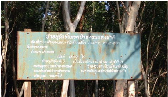
ภาพที่ 3 เขตพื้นที่ป่าสงวนแห่งชาติป่าดงภูพาน - ดงกะเมอ (พื้นที่ปลูกป่ายุคาลิปตัสของ ออป.)

อยู่ล้อมรอบชุมชน ซึ่งแบ่งออกหลายประเภทขึ้นอยู่กับลักษณะการใช้ประโยชน์และบนพื้นฐานความเชื่อของชุมชน อาทิเช่น ปาดอนปู้ตา ป่าช้า เป็นต้น