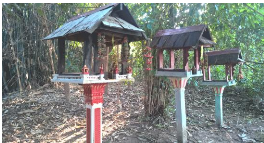
ภาพที่ 4 พื้นที่ปาดอนปู้ตาพื้นที่ประมาณ 20 ไร่

องค์ความรู้ และองค์กรชุมชนด้านการจัดการป่าอย่างมีส่วนร่วม ในเขตพื้นที่ป่าต้นน้ำหนองหาร จังหวัดสกลนคร ชุมชนหุบเขาเป็นพื้นที่ที่มีประวัติศาสตร์การย้ายถิ่นฐานมายาวนาน และที่ตั้งชุมชนเป็นแอ่งหุบเขามิพื้นที่ป่าไม้ล้อมรอบ โดยเฉพาะพื้นที่ป่าในการดูแลของกรมป่าไม้คือ พื้นที่ป่าสงวนแห่งชาติป่าดงชมภูพาน - ป่าดงกะเมอ และพื้นที่ป่ายุคาลิปตัสขององค์การอุตสาหกรรมป่าไม้ (ออป.)