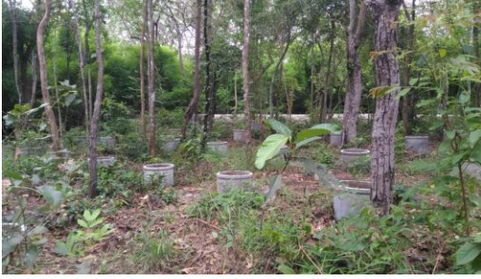
ภาพที่ 5 แปลงวนเกษตรป่าวัดถ้ำเลี้ยงของ

อย่างไรก็ตามชุมชนมีพยายามปรับตัวเรียนรู้ เพื่อให้เกิดประสิทธิภาพและประสิทธิผลในการจัดการ ทรัพยากรป่าไม้ได้อย่างยั่งยืนโดยชุมชน ที่สอดคล้อง กับงานศึกษาการนำเสนอข้อมูลเชิงประจักษ์และมี ประสิทธิภาพในการจัดการทรัพยากรป่าคือ แนว ทางการจัดการทรัพยากรป่าไม้ในรูปแบบของ “ป่า ชุมชน” (กฤษฎา บุญชัย, 2547) เหมือนกับชุมชนอื่นๆ ที่กระจายตัวกันทั่วภูมิภาคของประเทศไทย เหมือนทั้ง 2 พื้นที่กรณีศึกษา หากหน่วยงานส่งเสริมกระบวนการ มีส่วนร่วมของชุมชนได้มากน้อยแค่ไหน หรือเพียงทำ ตามนโยบายของหน่วยงาน หรือส่งเสริมให้ชุมชนเกิด การเรียนรู้กระบวนการจัดการป่าร่วมกันเพื่อให้เกิด ความยั่งยืนอย่างแท้จริงต่อไป