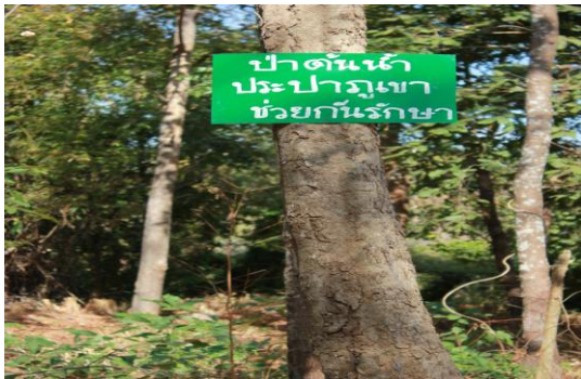
ภาพที่ 2 เขตพื้นที่ต้นน้ำสำหรับการผลิตประปาภูเขา

ที่ 3 (ต่างอย) ในระดับพื้นที่เพื่อการพัฒนาคุณภาพชีวิต โดยการส่งเสริมระบบเกษตรกรรมและวิชาชีพ ผลผลิตทางการเกษตรของชุมชน สภาพพื้นที่หรือลักษณะภูมิประเทศจึงเหมาะแก่การเกษตรทั้งการปลูกพืชและการเลี้ยงสัตว์ อย่างไรก็ตามวิถีชีวิตของชาวบ้านยังสัมพันธ์กับป่าอย่างต่อเนื่องเพราะเป็นแหล่งอาหารที่สำคัญของชุมชน มีการส่งเสริมให้มีโครงการจัดตั้งป่าชุมชนหรือการจัดการป่าแบบสมัยใหม่ จำนวน 558 ไร่ จากหน่วยงานระดับพื้นที่เมื่อปี พ.ศ. 2544 เนื่องจากพื้นที่รอยต่อบางส่วนติดเขตพื้นที่ป่าของรัฐทั้งในส่วนของอุทยานแห่งชาติภูผายลและป่าสงวนแห่งชาติภูล่อมข้าว-ป่าภูเพ็ก