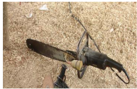
บาร์หรือเลื่อยยนต์เป็นเครื่องมือสำหรับการตกแต่งลวดลาย