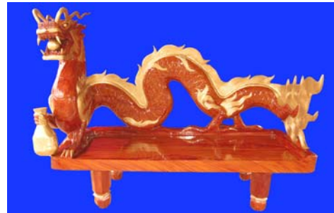
รูปทรงในปัจจุบัน

2. ด้านองค์ความรู้พบว่า ช่างแกะสลักส่วนใหญ่มีทั้งเพศหญิงและชายอายุระหว่าง 30-55 ปี และต่ำกว่า 30 ปี แสดงให้เห็นว่าเพศและอายุไม่เป็นอุปสรรคต่อการแกะสลัก ความโดดเด่นของงานแกะสลักพบว่า เป็นการแกะสลักงานชิ้นใหญ่โดยเน้นรูปทรงเป็นโซฟามังกรเป็นหลัก ซึ่ง ลวดลายและความอ่อนช้อยของมังกรแต่ละตัวจะมีความแตกต่างกันทั้งนี้ขึ้นอยู่กับจินตนาการ ประสบการณ์ในการแกะสลักของช่างแต่ละคน และมีการพัฒนารูปทรงของมังกรเพื่อให้เป็นที่ ดึงดูดใจของลูกค้าตามยุคสมัย และยังส่งผลให้ลักษณะของชิ้นงานในแต่ละท้องถิ่นมีความ