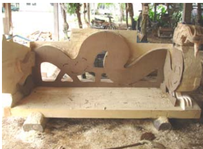
แบบพิมพ์เป็นเครื่องมือสำหรับการออกแบบ

แตกต่างกัน ไปด้วย ซึ่งสอดคล้องกับที่ชุตินา หวันชิตนาย (2547) ได้กล่าวถึงลักษณะของหัตถกรรมพื้นบ้านของแต่ละท้องถิ่นจะแตกต่างกันขึ้นอยู่กับวัสดุในท้องถิ่น และฝีมือของชาวบ้านในการสร้างสรรค์ผลงาน เครื่องมือที่ใช้ในการแกะสลักมี 2 ประเภทคือ เครื่องมือสำหรับการแกะสลัก ซึ่งพบว่าเครื่องมือหลักที่สำคัญคือ สิ่ว มี 3 แบบ ได้แก่ สิ่วหน้าตรงใช้สำหรับแกะสลักลวดลายตามโครงร่างให้เส้นลึก คม สิ่วตัววีใช้สำหรับเดินเส้นลวดลายให้มีความอ่อนช้อย จะใช้แกะกริบ เกี๊ยด ขน และสิ่วตัวยูหรือสิ่วโค้ง แกะสลักให้เป็นร่องและตกแต่งชิ้นงาน ขนาดของสิ่วที่ใช้ขึ้นอยู่กับขนาดของลวดลายที่ต้องการ ซึ่งสอดคล้องกับงานวิจัยทรงเดช สุทธสา (2545) ที่พบว่าผู้ประกอบการอาชีพแกะสลักไม้ส่วนใหญ่จะใช้อุปกรณ์ที่มีขนาดเล็กและใช้ฝีมือแรงงานจากคน เช่น สิ่ว ค้อน ซึ่งหาซื้อได้ง่ายในท้องถิ่นและราคาไม่แพงมากนัก และยังสอดคล้องกับที่วัลลภ ไชยพรหม (2529) ได้กล่าวถึงเครื่องมือที่นับว่ามีบทบาทที่สุดในการแกะสลักลวดลายคือ สิ่วโค้งหรือสิ่วเล็บมือนาง และเครื่องมือสำหรับออกแบบและตกแต่งลวดลาย ได้แก่ บาร์หรือเลื่อยยนต์ ซึ่งเป็นเครื่องมือที่ผู้ผลิตคิดค้นขึ้นมาเอง มีส่วนประกอบคือ โซ่ บาร์ และเลื่อยไฟฟ้าใช้ตกแต่งไม้ให้เป็นรูปทรงของมังกร เลื่อยจิ๊กซอร์ เป็นเครื่องมือสำหรับการตัดลวดลายส่วนโค้ง กบไฟฟ้า เป็นเครื่องมือสำหรับการลบเหลี่ยม เครื่องขัดไฟฟ้าเป็นเครื่องมือสำหรับการขัดให้ตัวมังกรมีความกลมกลืนเป็นเนื้อเดียวกัน แบบพิมพ์ เป็นเครื่องมือสำหรับการวาดโครงร่างของตัวมังกร