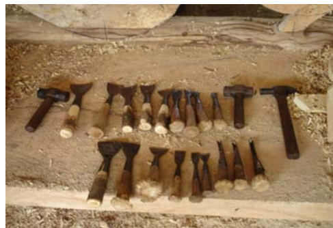
สิ่ว เป็นเครื่องมือหลักสำหรับการแกะสลัก