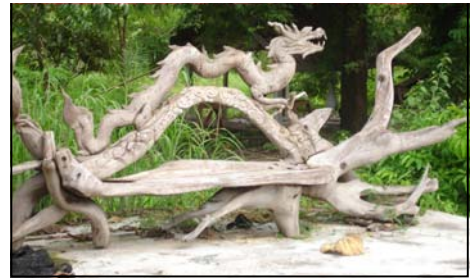
รูปทรงในอดีต